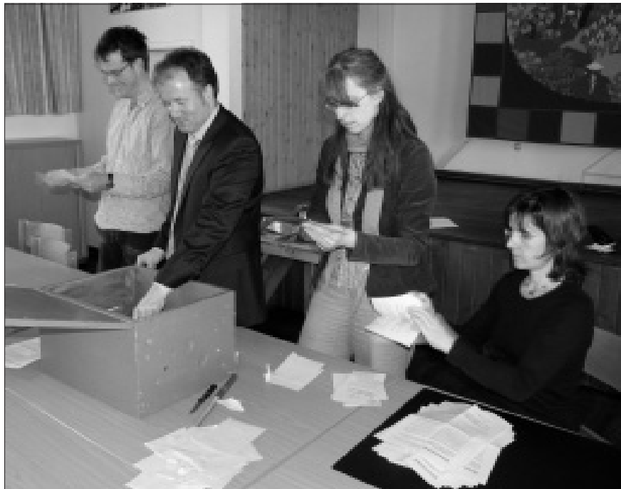
Wie geht's aus? Bei der Auszählung der Stimmzettel am 10. April 2011