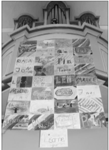
KUst unter der Orgelempore