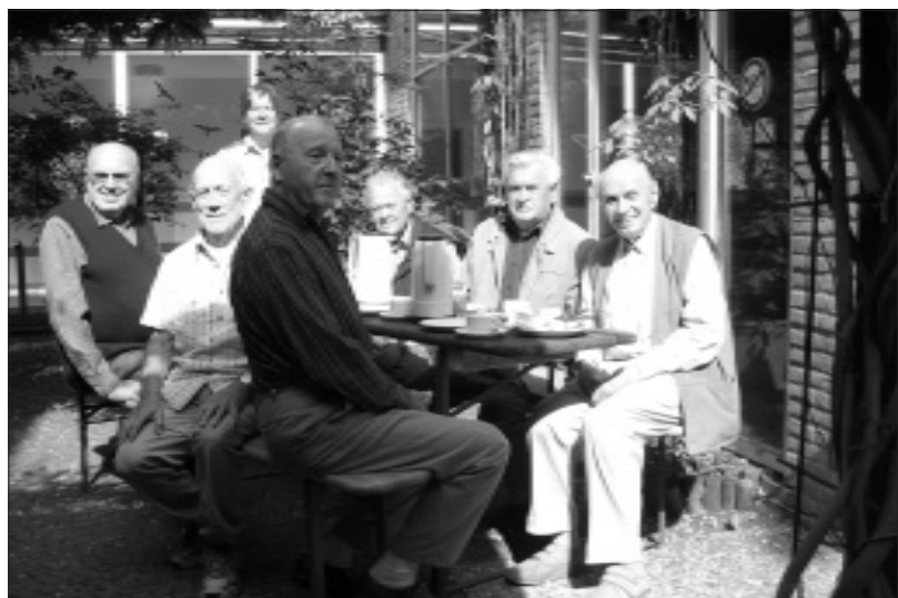
Suchen immer einen Platz an der Sonne, besonders, wenn das Gemeindehaus Baustelle ist: Der Männerkreis