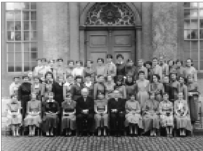
Die nächste Goldene Konfirmation für die Jahrgänge 1961 und 1962 ist am 20. Mai 2012.

In den 50er Jahren wurde am Palmsonntag konfirmiert und erst nach diesem Ereignis gingen wir dann in einem zweiten feierlichen Gottesdienst am Gründonnerstag gemeinsam mit der Familie zum ersten Abendmahl. Das Aussuchen des Konfirmationsspruches blieb unseren Pastoren vorbehalten. Dass mein Konfirmationsspruch Römer 8, Vers 28 eine schwierige theologische Aussage enthielt, wurde mir erst klar, als ich ihn später nachschlug. Nur der recht unbeschwertere erste Teil steht auf meiner Konfirmationsurkunde. Die Lebensumstände der 50er Jahre bestimmte den Rahmen des Festes. Meiner Tante und meiner Kusine aus Nordhausen war die Reise nach Göttingen von den DDR-Behörden verwehrt