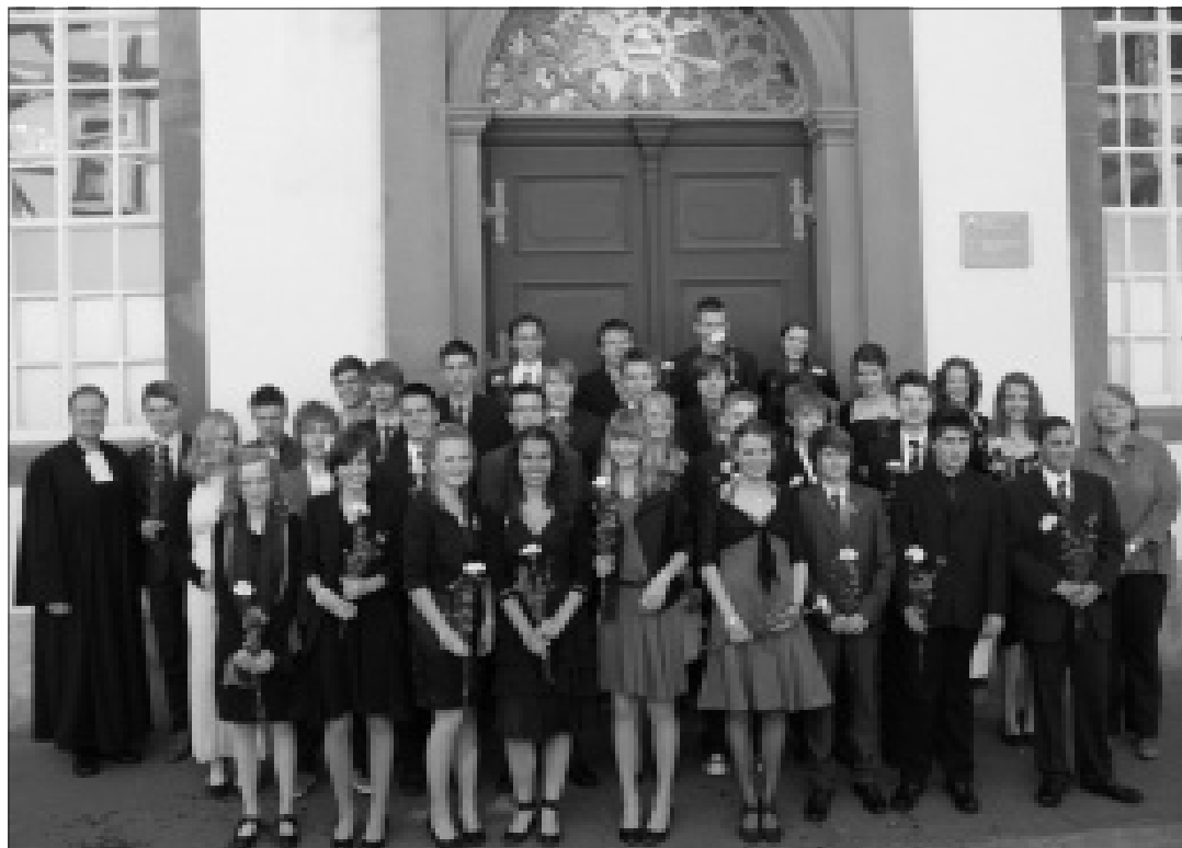
So sehen Konfirmandinnen und Konfirmanden heute aus: Taufe und Konfirmation am 8. Mai 2011